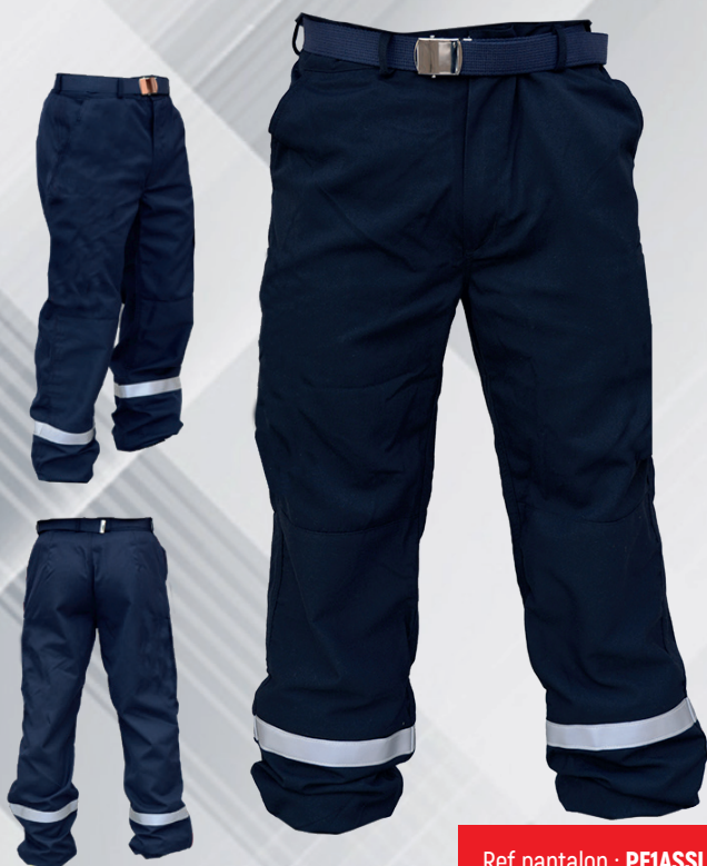
Ref pantalon : PFIASSLBLBG

🔧 NF EN ISO 13688:2013+A1:2020 🔧 ISO 11612:2015:A1,B1,C1 🔧 NF EN ISO 1149-5:2018 - ZONE ATEX 1, 2, 20, 21, 22